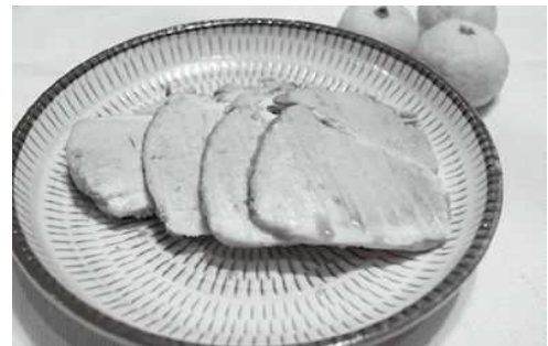
多摩きたSNSでも詳しく紹介中