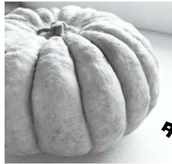
江戸東京野菜・内藤かぼちゃ

*種苗法 優良な品種を保護、新品種の開発を促進する制度。F1品種の多くは登録品種のため種苗法で保護されている。登録品種は自家採種した種や、その種から育てた苗や作物は販売・譲渡が禁止されている。