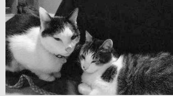
子猫の時に拾ってきた人懐っこい猫です。