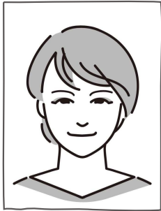
まち・国立 組合員

総利用高 30,677,254 円 (1月配送) 世帯当り 21,186 円 (1月配送) (1月31日現在)