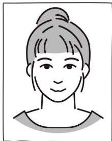
まち・小平 組合員

組合員数 14,974人 (2024年4月末) 会費 5,833円 加入者数 123人 (2024年度累計) 会費 49円 脱退者数 148人 (2024年度累計) 会費 -47円 総利用高 41,572,324円 (5月配送) 世帯当り 26,378円 (5月配送) (5月29日現在)