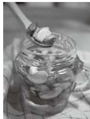
多摩きたSNSでも詳しく紹介中