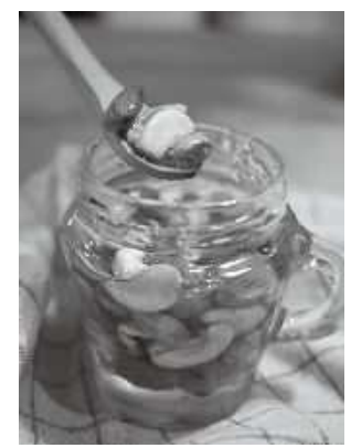
多摩きたSNSでも詳しく紹介中