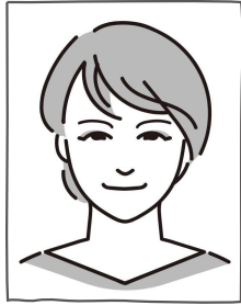
まち・きよせ 組合員

組合員数 14,948人 (2024年5月末) 加入者数 219人 (2024年度累計) 脱退者数 -258人 (2024年度累計) 総利用高 34,642,556円 (6月配送) 世帯当り 22,037円 (6月配送) (6月30日現在)