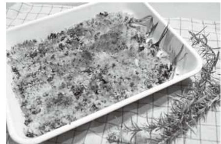
多摩きたSNSでも詳しく紹介中