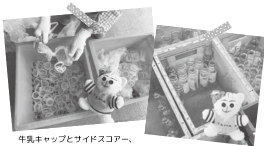
牛乳キャップとサイドスコアー、袋に入れないでね