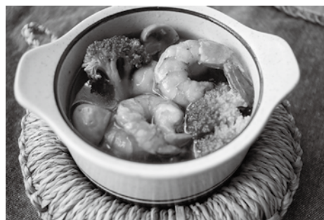
多摩きたSNSでも詳しく紹介中