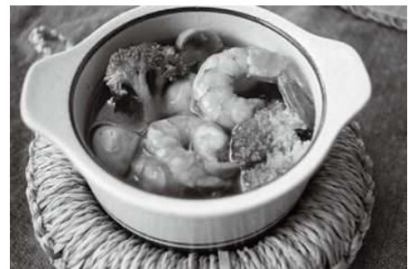
多摩きたSNSでも詳しく紹介中