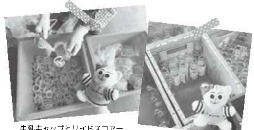
牛乳キャップとサイドスコアー、袋に入れないでね